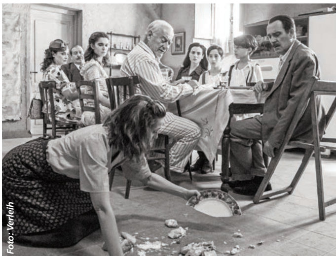
Andrea lässt sich scheiden; 20 Uhr Morgen ist auch noch ein Tag (OmU/italienisch; Szenenfoto). Karten: 0711-516812